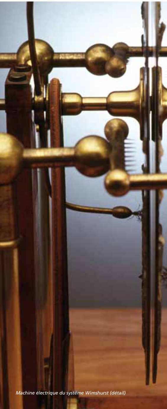
Machine électrique du système Wimshurst (détail)