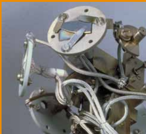
Recherche en physique des composants électroniques