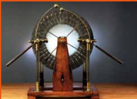
Machine électrique du système Wimshurst