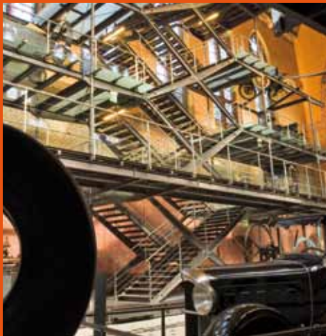
La structure conçue par l'architecte François Deslaugiers dans la chapelle du Musée des arts et métiers. Pneu Michelin Air X - Moteur à gaz de Lenoir, 1862 - Voiture Citroën type C6G, 1931.