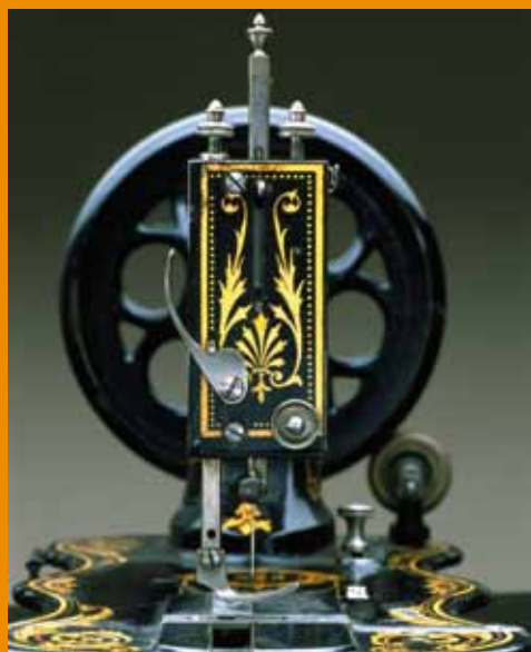
Machine à coudre type 13K, 1889, Société Singer