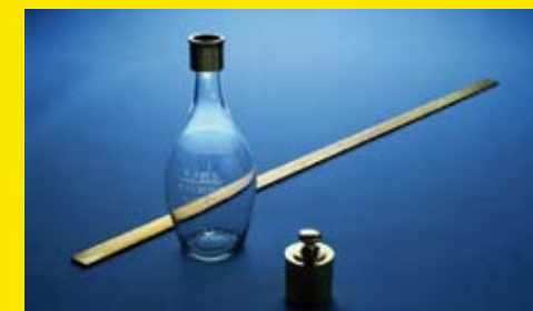
Trois unités de mesure : le cadil, le mètre et le kilogramme.